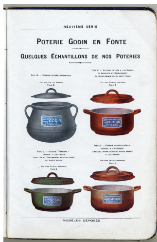
Les poteries en fonte émaillée dans l'album de reconstitution de 1922 de la Société du Familistère.