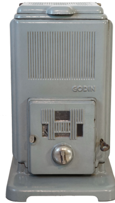
Foyer hygiénique n° 404