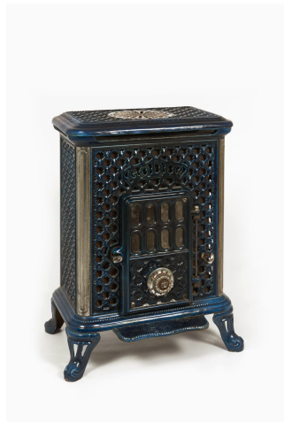
Foyer hygiénique n° 369 « Radiolette »

Notice créée le 09/05/2018. Dernière modification le 30/04/2019.