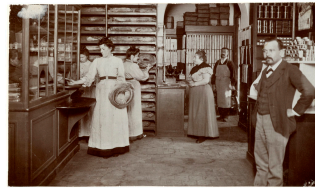
Le dépôt de pain dans l'épicerie du Familistère de Guise