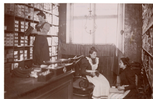
Le rayon des chaussures dans la mercerie du Familistère de Guise