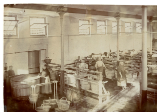
La buanderie du Familistère

Notice créée le 30/03/2021. Dernière modification le 02/04/2021.