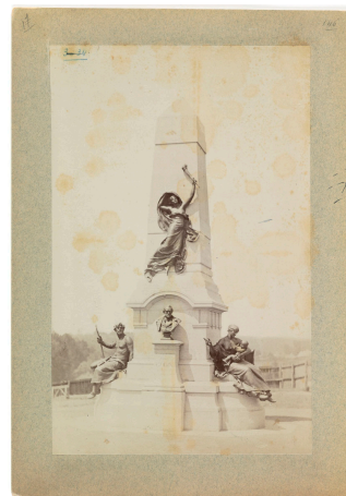
Le mausolée de Jean-Baptiste André Godin

Notice créée le 30/10/2018. Dernière modification le 08/11/2018.