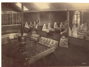
L'intérieur de la nourricerie du Familistère

Notice créée le 07/07/2018. Dernière modification le 27/08/2022.