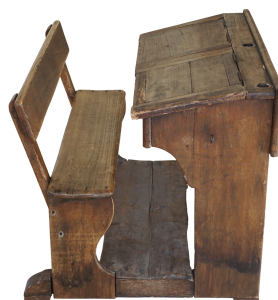
Table-banc des écoles du Familistère

Notice créée le 13/07/2018. Dernière modification le 27/08/2022.