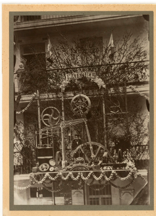
Le trophée de l'atelier du matériel de l'usine du Familistère

Notice créée le 29/10/2018. Dernière modification le 08/11/2018.