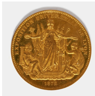
Médaille d'or de l'Exposition universelle de 1872 à

portrait ; Napoléon III ; couronne ; chêne