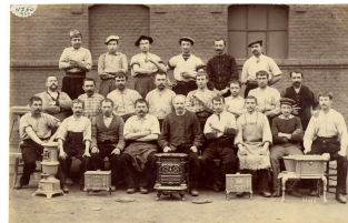
Un groupe d'ouvriers de l'atelier d'ajustage de l'usine du Familistère de Guise