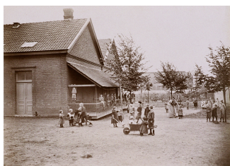
L'école du Familistère de Laeken. septembre 1898.