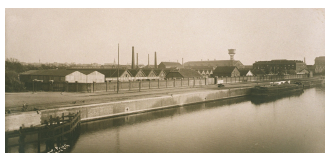
Le Familistère de Laeken le long du quai du canal de Willebroek. à

Guise. Pour accéder à la qualité de sociétaire ou d'associé, les travailleurs doivent, selon les statuts de l'Association, « habiter le Familistère ». Encore faut-il disposer d'un palais sociétaire. Pour que les travailleurs belges appartiennent pleinement à l'Association, il est nécessaire de bâtir une habitation à Laeken. Godin en forme le projet en 1883, au moment où s'achève à Guise le dernier grand chantier du Familistère, la construction du pavillon Cambrai.