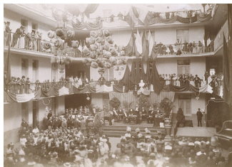
La cour intérieure de l'habitation du Familistère de Laeken, à l'occasion de la fête de l'Enfance. septembre 1898.