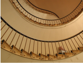
Un escalier de l'aile droite du Palais social.

ACCUEIL DÉCOUVRIR UNE ARCHITECTURE AU SERVICE DU PEUPLE LES CHIFFRES DU PALAIS