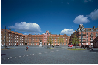
Vue du Palais social. Photographie Georges Fessy, 2016.

ACCUEIL DÉCOUVRIR UNE ARCHITECTURE AU SERVICE DU PEUPLE PHALANSTÈRE, FAMILISTÈRE ET CITÉS OUVRIÈRES